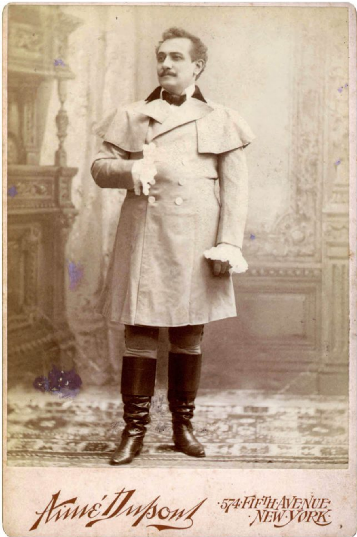
Emilio De Marchi as Cavaradossi in Puccini's Tosca .