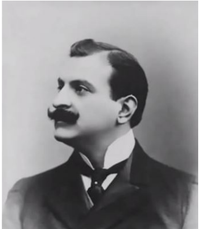
Antonio Scotti 1866-1936

Den höchsten dokumentarischen Wert hat aber der Sänger des Cavaradossi, denn von ihm gibt es im Gegensatz zu den beiden anderen keine kommerziellen Aufnahmen und die Tatsache, daß es just ein Tosca-Mitschnitt ist, der uns erhalten ist, wiegt doppelt: Emilio de Marchi war einer der führenden italienischen Tenöre, zu dieser Zeit in Italien noch populärer als Caruso und vor allem war er der Interpret des Cavaradossi bei der römischen Uraufführung der Tosca am 14. Januar 1900. Caruso hatte sich auch Hoffnungen gemacht, den Cavaradossi bei der Uraufführung zu singen, aber man entschied sich für De Marchi, der dann die Partie mit Puccini einstudiert hat. De Marchis Stimme ist wesentlich heldischer als die des jungen Enrico Caruso und in diesem Zusammenhang ist interessant, daß auch für die Mailänder Erstaufführung der Tosca am 17. März 1900 unter Toscanini mit Giuseppe Borgatti wiederum ein