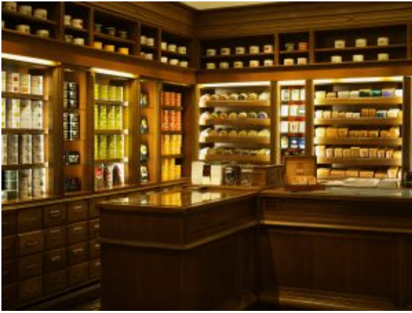
Pfeifen Huber im Tal