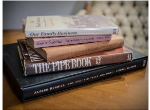
Dunhill Bücher aus der Sammlung des Autors

Dieser Luxus-Konzern versuchte uns unverbesserliche Romantiker, Nostalgiker und naive Schöngeister im alten Geist von Alfred einzulullen. Sie bieten teure Pfeifen an, tolle (teure) Tabake, wunderschöne Feuerzeuge und so weiter. Wir glauben, wir könnten mit dem Erwerb ein Teil dieser wenn auch nicht „guten, alten“ aber immerhin „kulturvolleren“ Zeit werden. Als noch Gentlemen, Herren im Tweed oder feinsten Savile-Row-Anzügen in den Laden in der Duke Street kamen und ihre eigene Mixture kauften. Hinter dem Tresen blätterte Alfred Dunhill in einem großen goldenen Buch, fand hinter dem Namen des Earl of Irgendwas dessen spezielle Tabakrezeptur. Er griff hinter sich ein paar große irdene Gefäße und wog die Mixture Nr. 123 für den Kunden ab.